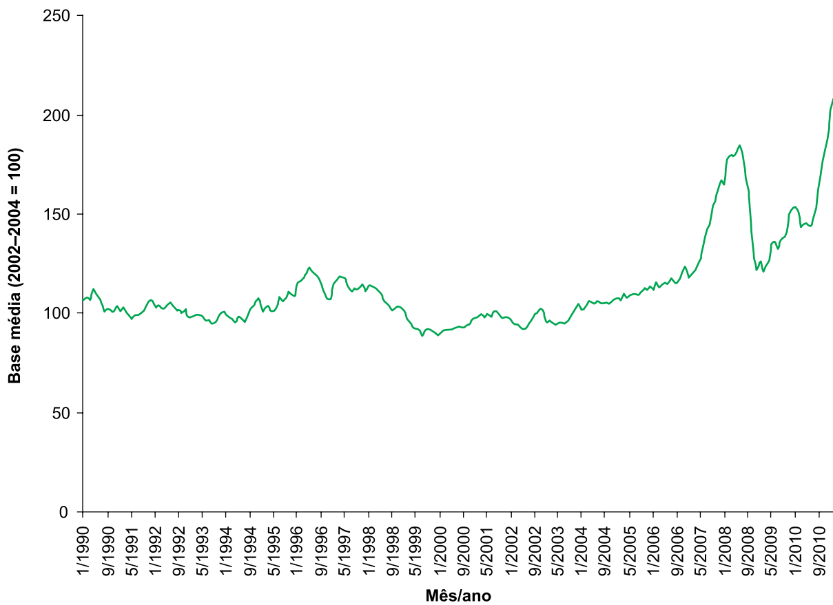
Figura 3. Evolução do índice de preços deflacionado das principais commodities de alimentação, no período de janeiro de 1990 a março de 2011.