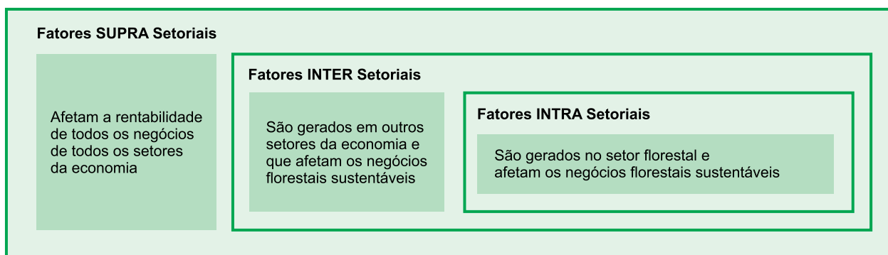
Figura 1. Modelo teórico do Índice de Atração ao Investimento Florestal.

O IADF é calculado pela média ponderada dos subíndices SUPRA , INTER e INTRA , com maior peso aos indicadores INTRA , intrínsecos à atividade florestal, e aos indicadores INTER , que possuem particular correlação com o rendi-